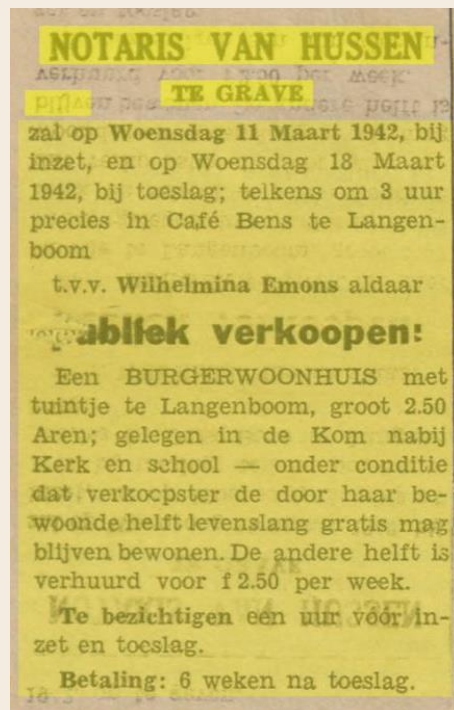
Bekendmaking van notaris Van Hussen in Grave in de Graafsche Courant, 1942

Het is ook niet niks, complete samenvattingen van aktes overtypen, maar die staan dan wel barstensvol namen van personen en plaatsen, toponiemen, handelingen en andere interessante informatie. Notarissen legden duizend en één dingen vast en na anderhalve maand hebben vrijwilligers al heel wat aktes over het scherm geschoven en ontcijferd. Toegankelijk maken op basis van eigentijdse toegangen, waarbij ook informatie wordt gevonden die níet in de uiteindelijke archieven is te vinden. Help je ook mee?