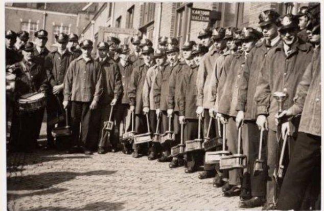
Op de foto: Ratelaars van de stadsreiniging. Deze kondigden in de straten met hun ratel aan dat de vuilnis buiten gezet kon worden.

In het project 'Volgende Patiënt!' zijn alle ongelukkigen uit de ziekenboek van het Binnen- en Buitengasthuis voor nu en in de toekomst vindbaar gemaakt. Gezien de razendsnelle voltooiing van dit project hebben wij gezocht naar een waardige opvolger. Die hebben we gevonden in de Pensioenkaarten van het Gemeentelijk Pensioenbureau Amsterdam!