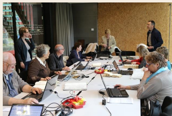
De deelnemers tijdens de inloopochtend in mei

Afgelopen maand was er weer een bijzondere mijlpaal, het honderdste boek is ingevoerd! Het honderdste boek was DTB Hoorn 40 met hierin een lijst van Friese Doopsgezinde lidmaten over de periode 1695-1747. De invoerder en controleurs van de laatste scan van het boek kregen tijdens de inloopochtend van acht mei een attentie. Voor alle deelnemers lagen er heerlijke koeken klaar.