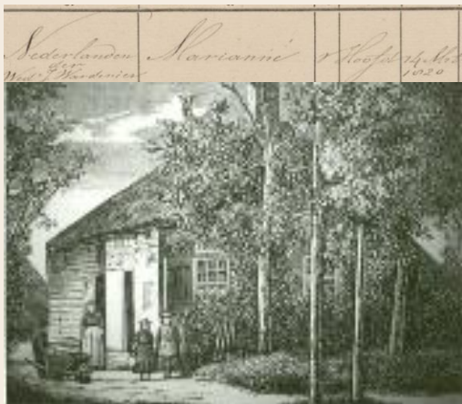
Koloniehuisje Willemsoord, Gemeentearchief Steenwijkerland, 99 Fotoarchief Steenwijk, inv.nr. 255)