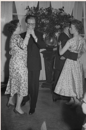
Deze notaris uit Berlicum hield wel van een dansje! Maar van hem komen de archieven nog niet online. (1957)