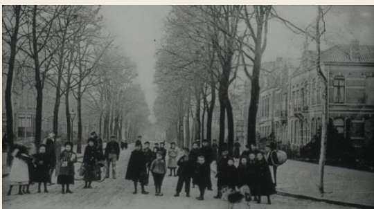
Foto: Poseren in de sneeuw op de Berg en Dalseweg in Nijmegen, ca. 1905.

Opnieuw is een project van VeleHanden (zo goed als) voltooid: het beschrijven van de bevolkingsregisters van de gemeente Nijmegen 1850-1890. In vijftien maanden tijd hebben ruim 200 vrijwilligers de gegevens van bijna 32.000 scans ingevoerd en gecontroleerd. Het Regionaal Archief Nijmegen (RAN) is zeer verrast door die snelheid en dankt alle deelnemers aan dit project hartelijk voor hun bijdrage.