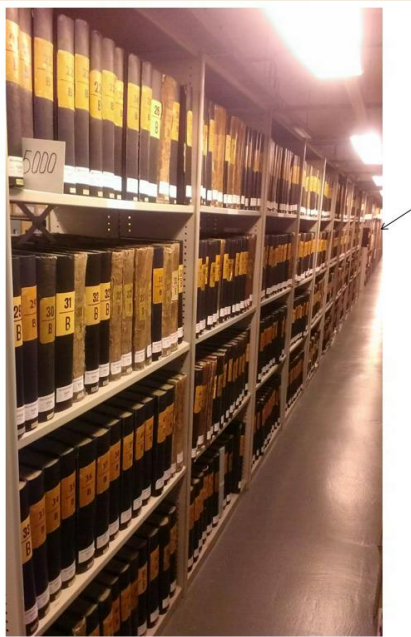
Foto: Het boek dat uit de kast steekt is het boek waar de 2.000.000e naam in staat.

Door jullie intensieve en consciëntieuze werk is een geweldige mijlpaal gehaald: 2.000.000 namen van de Bevolkingsregisters Amsterdam zijn dubbel ingevoerd en gecontroleerd! Dit staat gelijk aan 45 meter archief en 598 boeken. Ook zijn het ongeveer zoveel mensen als de inwoners van Parijs of 37 keer de ArenA vol. Kortom: ongelooflijk veel. Nogmaals heel veel dank aan alle deelnemers aan dit project! De namen zijn te doorzoeken via de Archiefbank .