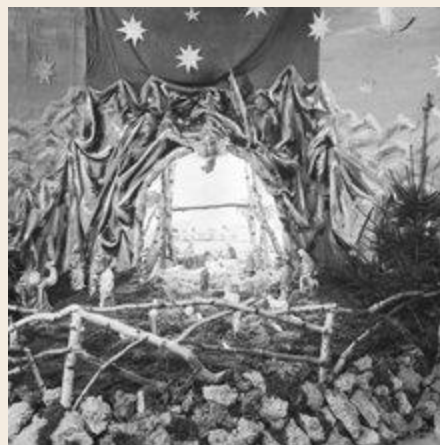
Kerststal in de strafgevangenis Nieuw Vosseveld in Vugt (1955)

Begin oktober zijn we gestart met 'Gezocht! Inkloppers van Brabantse gevangenisregisters 1821-1940'. Onze inkloppers zijn zo enthousiast (én fanatiek) dat het goed mogelijk is dat we al klaar zijn, zodra jullie dit lezen... Crimineel goed natuurlijk!