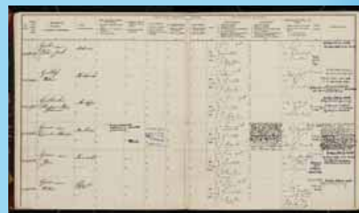
Lotingsregisters uit 1917.

de projectperiode gebruikmaken van de websites www.velehanden.nl en www.militieregisters.nl en de bijbehorende op maat ontwikkelde software. De voorwaarden voor deelname zijn dat de deelnemende archiefinstelling de scankosten van de geleverde militieregisters voor haar rekening neemt, in overleg met de productiebegeleider het scannen en het transport van de archiefstukken voorbereidt, en gedurende de projectperiode haar scans beschikbaar stelt voor levering aan derden via de webwinkel van de website, als onderdeel