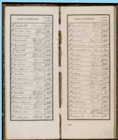
Naamindexen op de lotingsregisters, 1872.

Dat motiveert naar verwachting ook heel veel vrijwilligers.